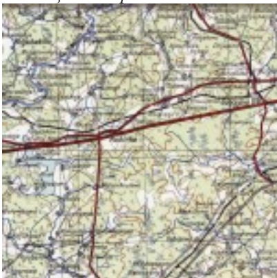
Немецкая карта 1941г.