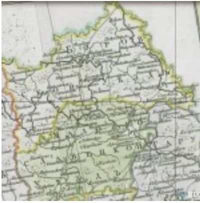
Калужское наместничество 1785г.