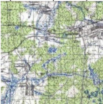
Немецкая карта 1941г.