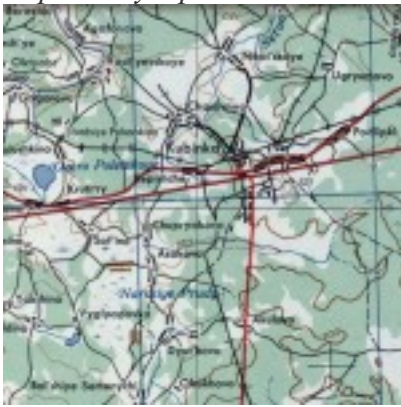
Карта США 1953г.