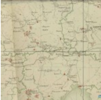
Карта Звенигородского уезда 1927г.