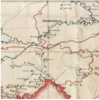
Раскольничьи селения 1871г.