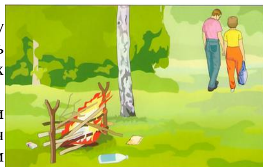
Разведение костров, поджигание сухой травы (палы)