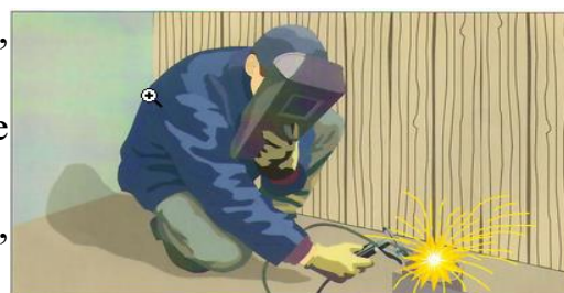
Нарушение правил проведения сварочных работ